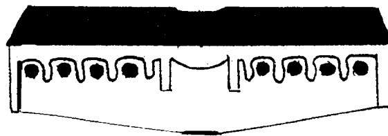
Schéma d'une plaque électrique