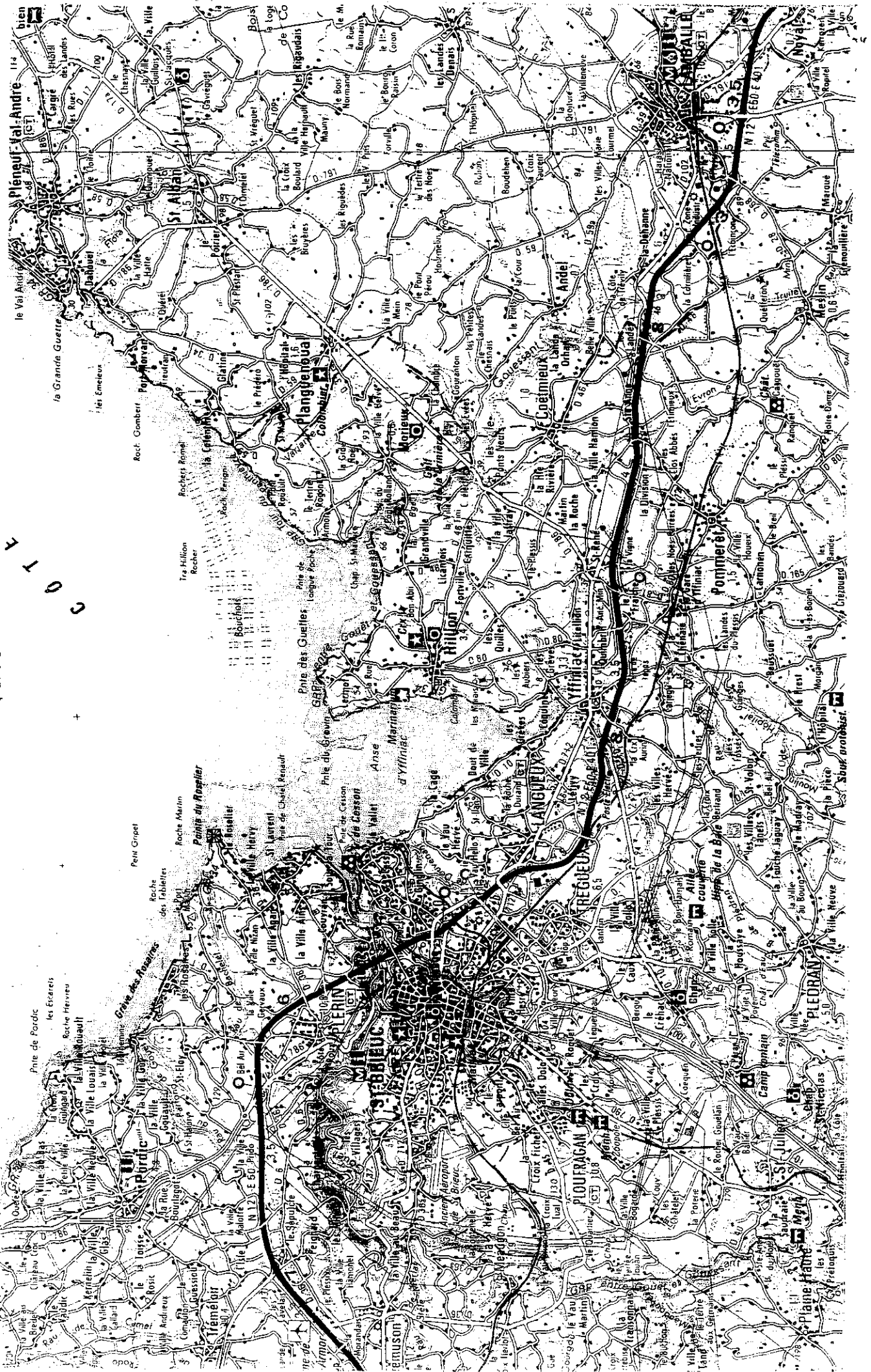
Document 2b : Extrait de la carte IGN au 1/100 000 de Saint-Brieuc/Morlaix, 1998