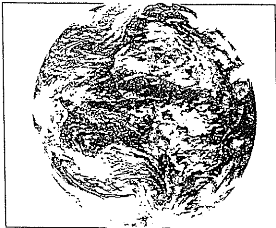
(Ul luc'hskeudenn Graet gant ur satellit)

En amzer a-vremañ e c'hell ar luc'hskeudenn "satellit"..... reiñ skoaz deomp ivez.