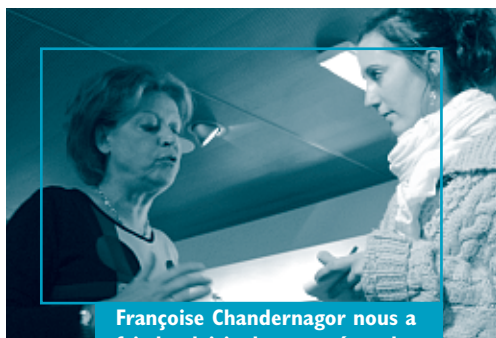
Françoise Chandernagor nous a fait le plaisir de nous répondre.

Pour l'académicienne, Françoise Chandernagor : « La sélection Goncourt est très différente d'une année sur l'autre, cette année, c'est une rentrée romanesque incroyable, un vrai plaisir de lecture. Je suis ravie et surprise du choix des élèves car il relève plus de mon adolescence que de la leur. J'espère que ce choix va inciter d'autres lycéens à découvrir le livre ! »